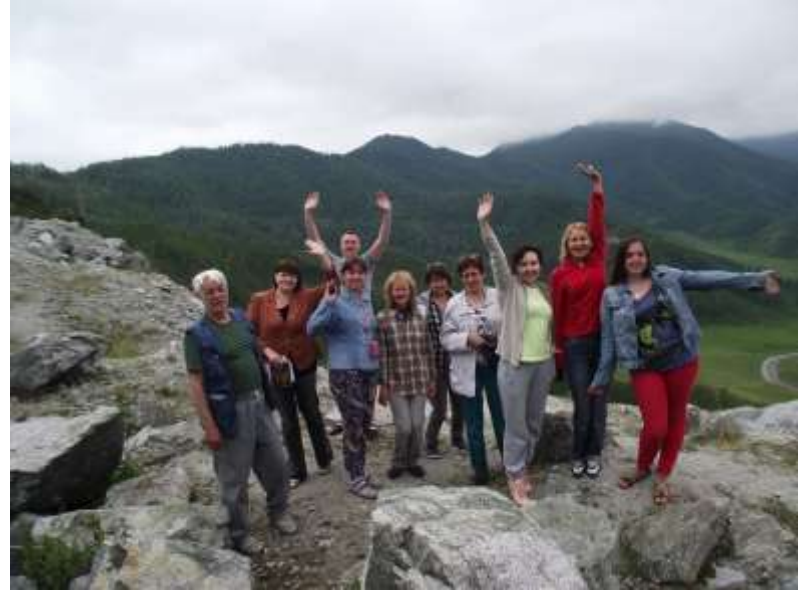
Пленэр на Горном Алтае

Нужно сказать, что в этом направлении учителя ИЗО города плодотворно сотрудничают с Томским областным художественным музеем. Почти десятилетний опыт этого сотрудничества позволил сложить апробированную стройную систему взаимодействия школы, учреждений дополнительного образования и музея. В рамках сотрудничества Центра музейной педагогики и ГМО учителей ИЗО, педагоги имеют возможность посещать с экскурсией художественные выставки; встречаться с художниками, в том числе и с томскими; посещать мастер-классы известных томских мастеров; участвовать в обучающих семинарах, городских и выездных пленэрах; участвовать в персональных и виртуальных выставках педагогов. И это, не считая художественных выставок, фестивалей и программ музея для детей. В 2017-18 учебном году состоится 3-я областная конференция «Томские художники» для детей и педагогов.