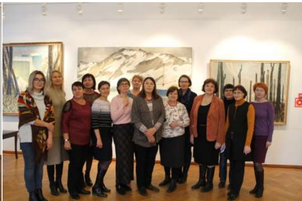
Городское МО на выставке Г. Завьялова

Руководствуясь письмом департамента общего образования Томской области от 19 июля 2017 года, следует сказать о новых приоритетных направлениях развития образовательной области «Искусство».