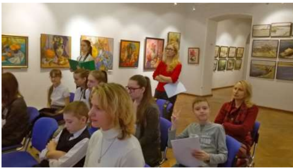
Областная конференция «Томские художники»